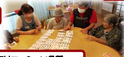
レクリエーション各種